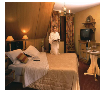
Salle de bain Chambre spa- cieuse et boisée N°14