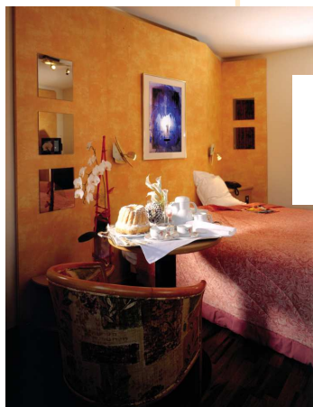
Chambre Très agréable N° 4